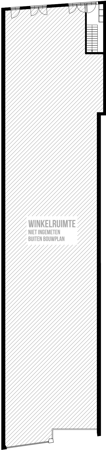
BEGANE GROND bestaande situatie